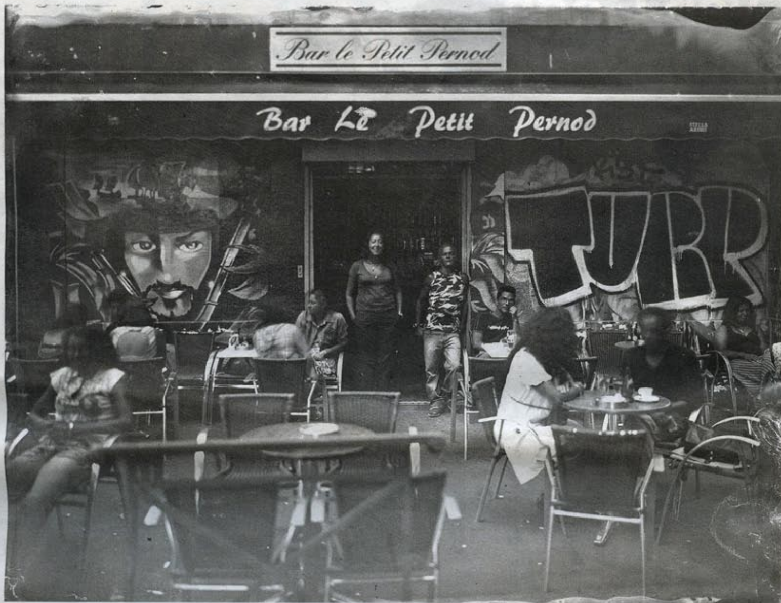
Terrasse du Petit Pernod, place Jacques-Boudouresque, dite place du Chien saucisse.