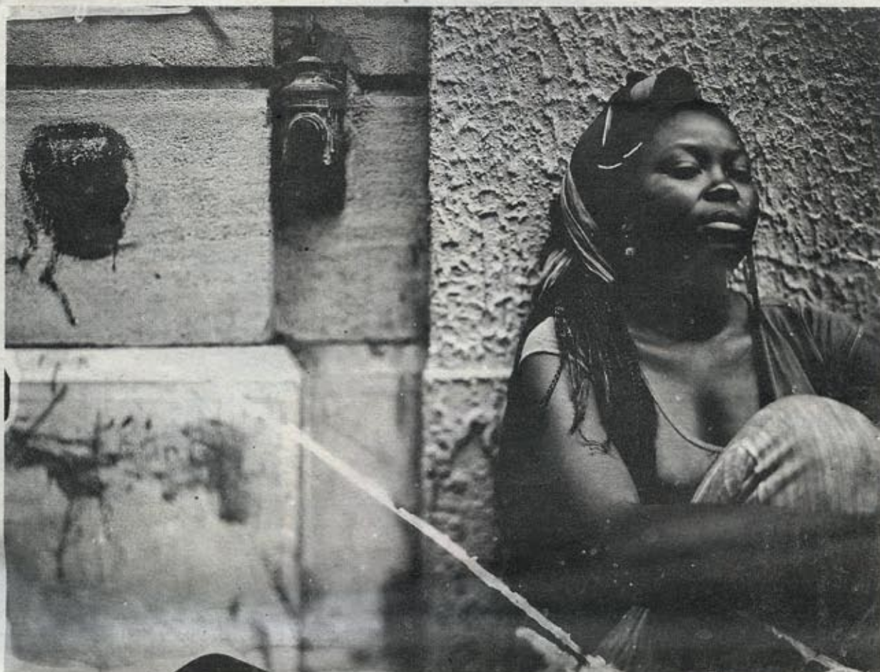
A côté de chez Godjo, association africaine.